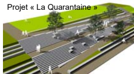
Projet « La Quarantaine »

Les élèves vont visiter des écoquartiers à Lyon et à Villefranche, et partager leurs expériences d'actions éco-citoyennes. Ils vont aussi mettre leur créativité en avant en fabriquant ensemble à partir de déchets recyclés des œuvres d'art et des vêtements. La semaine sera donc riche en événements et en échanges linguistiques (la communication se fera en effet en anglais allemand et français). Ce sera aussi l'occasion de nouer des amitiés à l'échelle européenne !